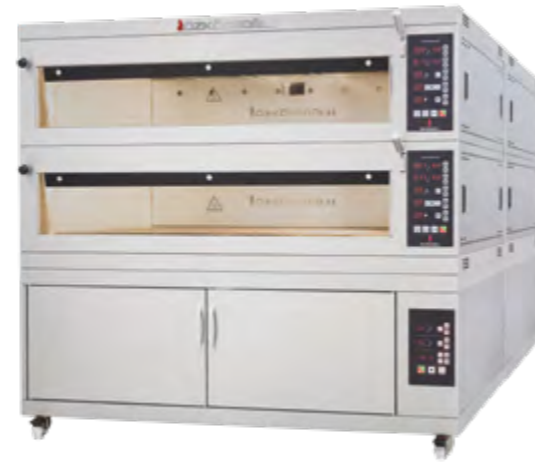
MFE - 200 Modüler Katlı Fırın Moduler Deck Ovens

Özköseoğlu Modüler Fırınlar; küçük işletmeler, pastaneler, oteller, restoranlar için geliştirilmiş çok amaçlı ürünlerdir. İhtiyacınıza göre modül tipi ve sayısını belirleyerek kapasitenizi oluşturabileceğiniz, ve gerektiği an arttırabileceğiniz üzere tasarlanmıştır. Pastane ürünlerinde taş taban lezzetini sunarken, bağımsız çalışabilen pişirme modülleri sayesinde eş zamanlı olarak farklı ürün tipleri için kullanıma uygundur. Her modülde bulunan çift ısıtıcı sistemi sayesinde pişirme gözündeki alt ve üst sıcaklıklar da ayrı ayrı kontrol edilebilmektedir