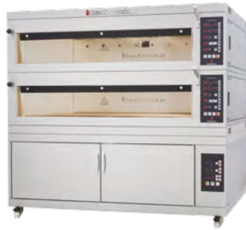
MFE - 100 / MFE - 120 Modüler Katlı Fırın Moduler Deck Ovens