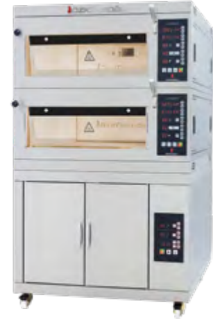
MFE - 50 Modüler Katlı Fırın Moduler Deck Ovens